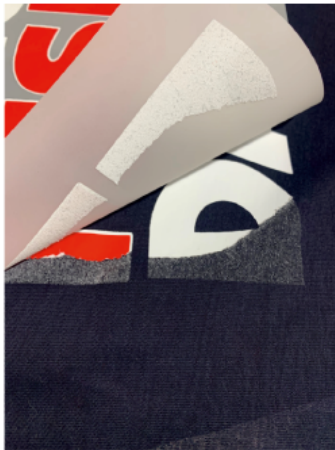
Este transfer foi aplicado com pressão adequada mas com temperatura insuficiente.