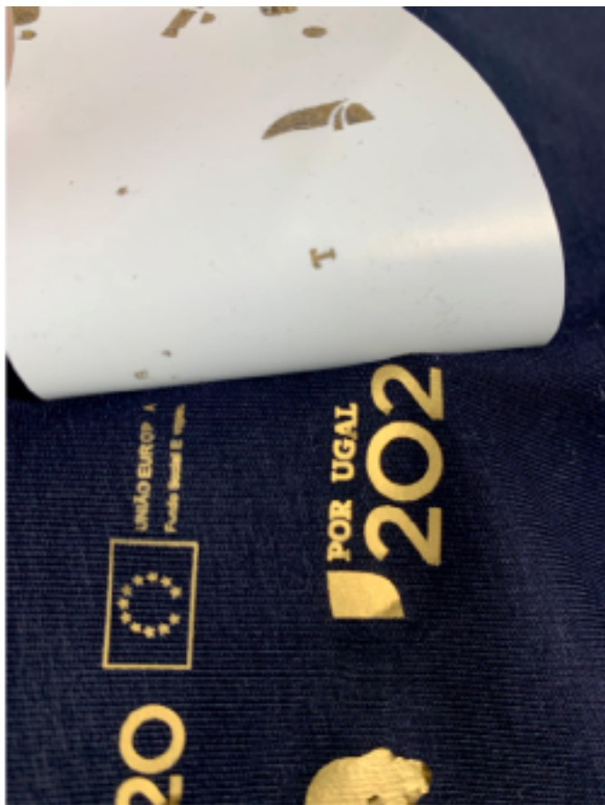
Este transfer foi aplicado com temperatura e pressão insuficiente.

Se o transfer foi aplicado com temperatura insuficiente, não aderirá totalmente á roupa, parte da tinta será transferida para a roupa e outra parte será deixada no folha, neste caso o transfer pode arranhar ou descascar o transfer da roupa.